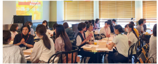
実際の活動の様子